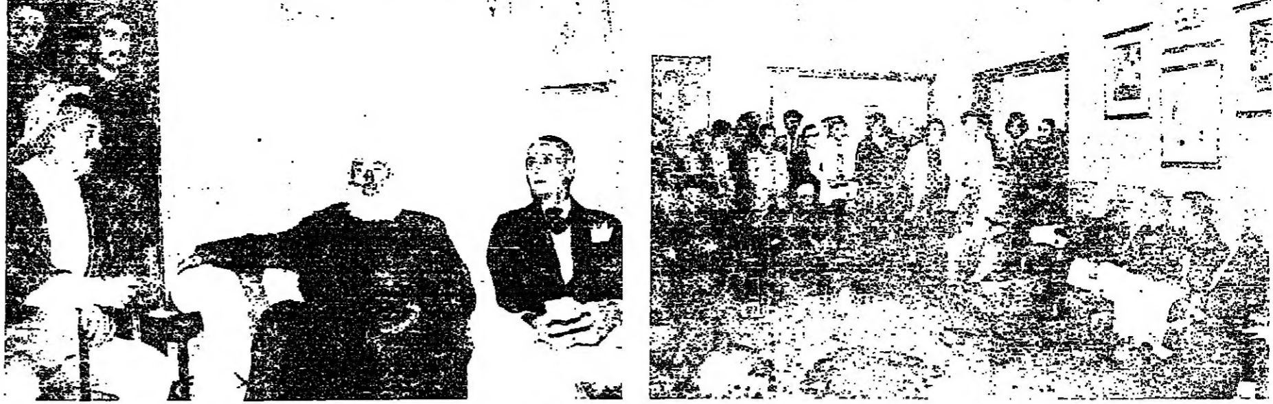
وفود شعبية من عاليه والشوف تعبر عن تقيدها للمجمعين